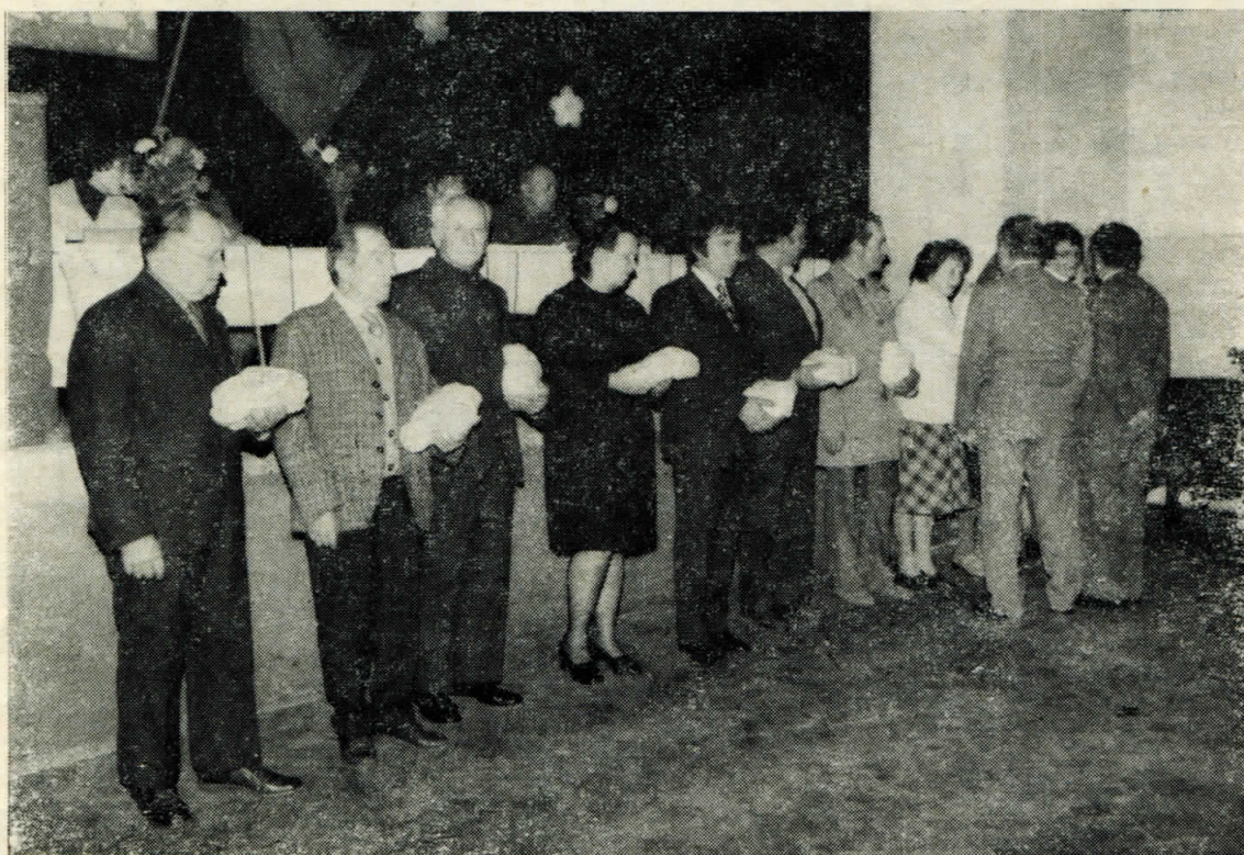
Vyhodnocení nejlepších pracovníků obce při květnovém slavnostním zasedání MNV.